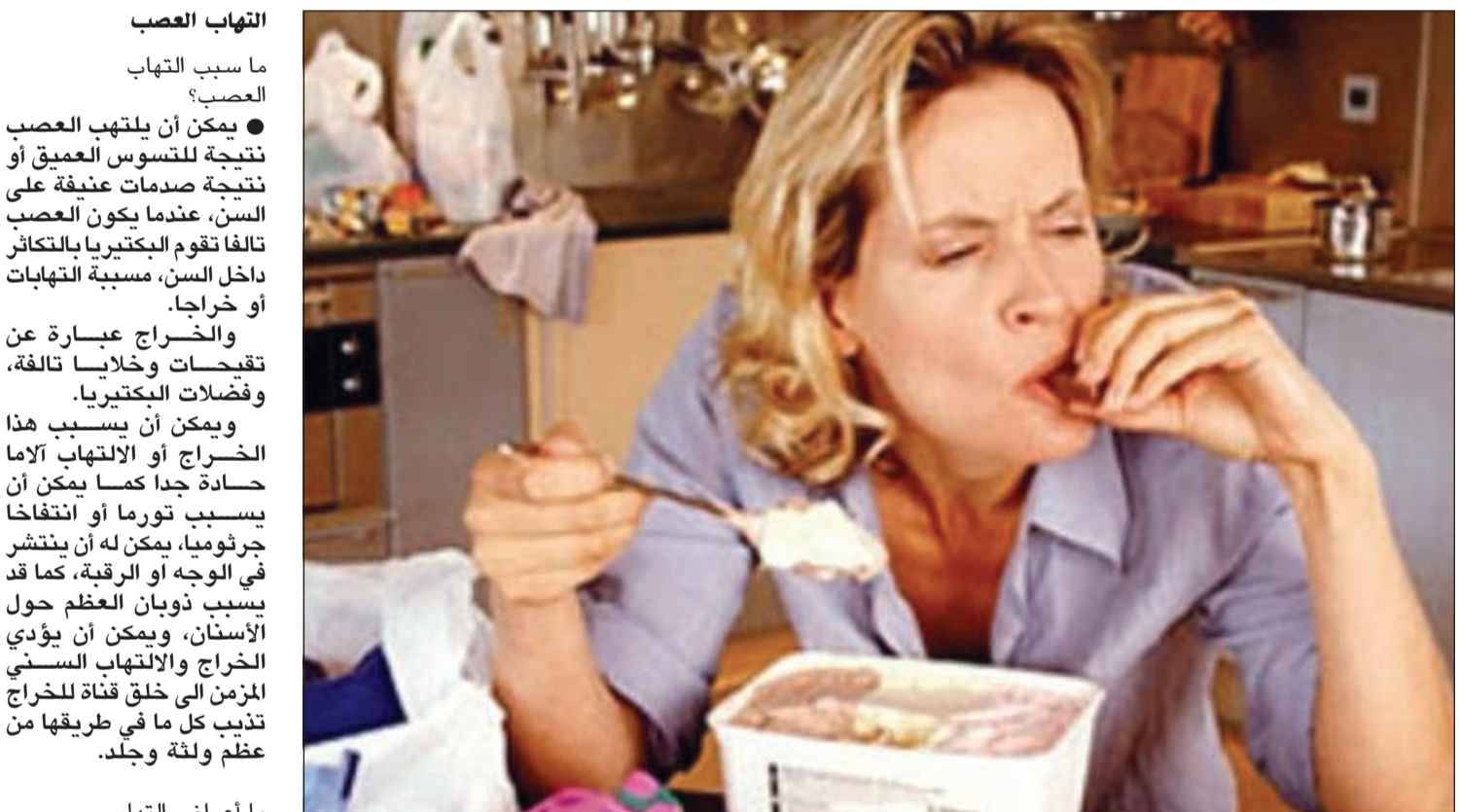
وجود البلاك أو الجير يؤدي إلى نزف اللثة عند تناول الطعام

متى يلجأ الطبيب الى علاج عصب الأسنان؟ اذا كان التسوس عميقا لدرجة انه ادنى الى موت عصب او لب السن، فهنا يلجأ الطبيب الى علاج عصب السن، وذلك