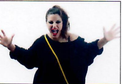
استعمال التمارن العالية من أسباب أورام الحنجرة

● يسبب أكثر التاريخ المرضي بدقة ويعمل الفحص الأيديولوجي ويخص بالفحص الضوئية للكشف عن البلعوم والحنجرة، كما تجرى الأضعة